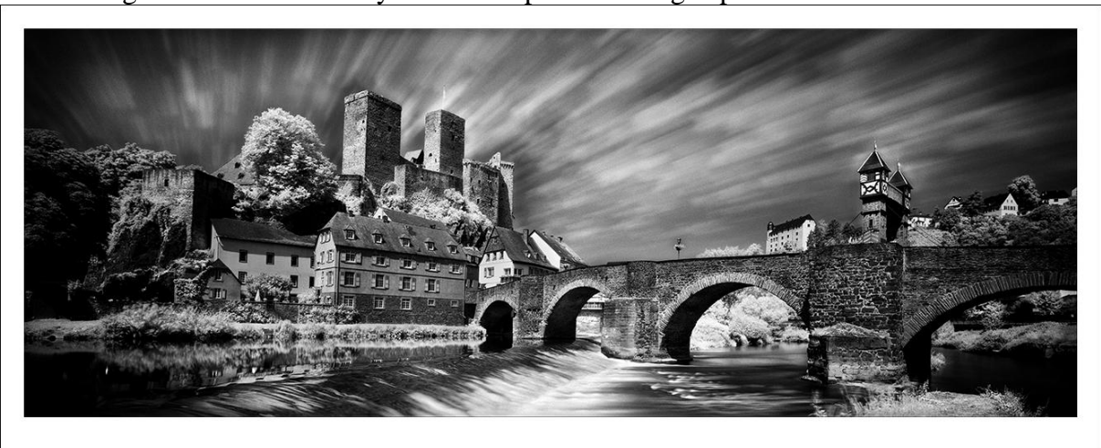
Beispiel 1: perfektes Bild von Burg Runkel an der Lahn

Um es gleich vorweg zu nehmen: das Buch ist etwas ganz besonderes und fasziniert gleich beim ersten „in die Hand nehmen und blättern“ derartig, dass man es eigentlich nur deswegen aus der Hand legt und nicht bis zum Ende durchblättert, weil es groß und schwer ist. Ob die Machart wirklich einzigartig und so noch nie da gewesen ist, kann der Rezensor nicht verifizieren. Aber die Schönheit der Bilder und vor allem der ganz besondere Eindruck, den die Bilder hinterlassen, sind auf alle Fälle mehr als nur beeindruckend. Man nimmt dem Fotografen auf alle Fälle ab, dass sehr viele Fotos gemacht und aufwendige Nacharbeiten angestellt wurden, um letztendlich DAS perfekte Foto einer jeden behandelten Burg präsentieren zu können. Die Aufnahmen spiegeln durch die gewählte Schwarz-Weiß-Darstellung insbesondere den mystischen Aspekt der Burgen perfekt wieder.